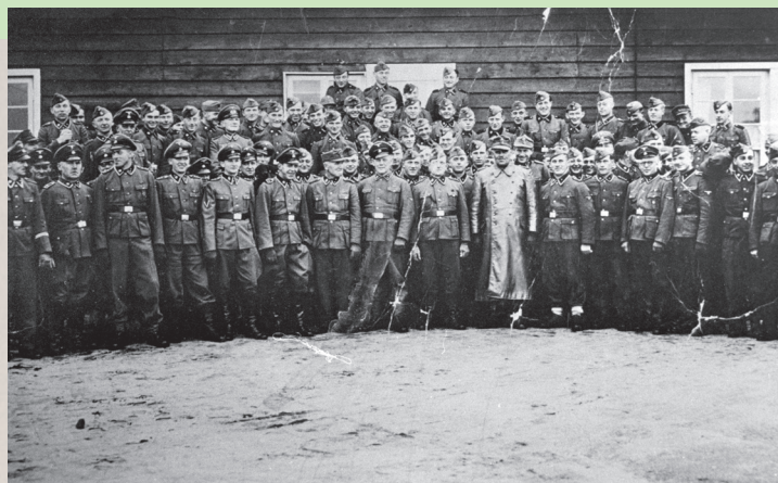
Lagerkommandant Adolf Haas mit SS-Personal des KZ Bergen-Belsen ca. 1943